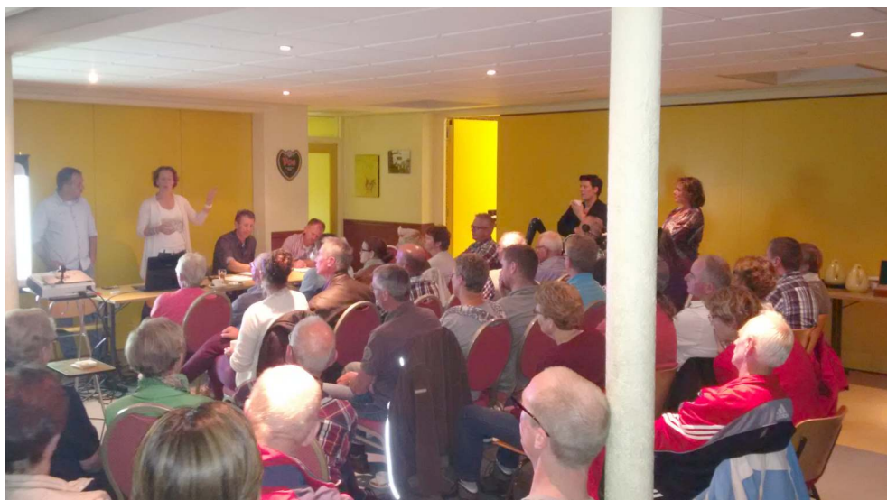
Grote belangstelling op 22 september 2014.

Wij proberen onze doelen onder andere te realiseren door het regelmatig organiseren van bewonersbijeenkomsten in dorpshuis de