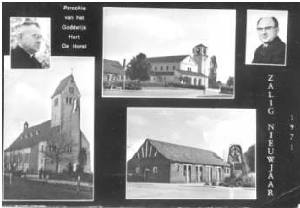
Nieuwjaarskaart van de Parochie van het Goddelijk Hart van Jezus De Horst.

Op dit moment zijn wij op De Horst met ongeveer 1250 inwoners, verdeeld over een 500-tal huizen.