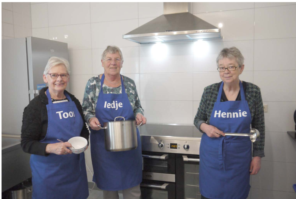
Het enthousiaste team van het Buurtsoepie De Horst in de door de provincie Gelderland gesubsidieerde nieuwe keuken van Dorpshuis de Slenk.