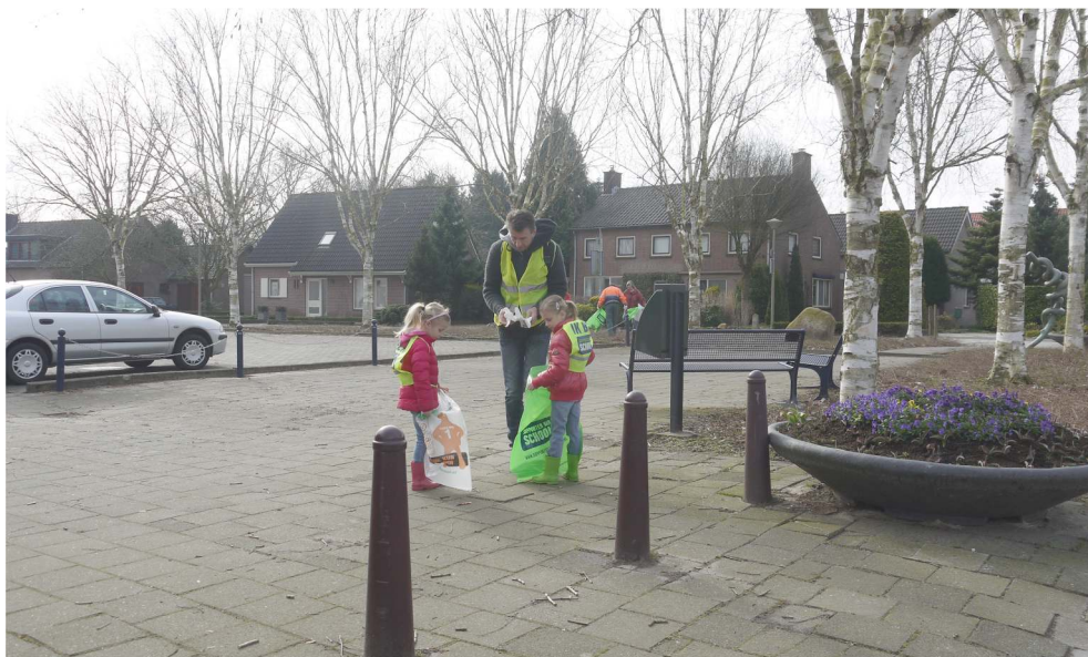
Met NL-Doet (in maart) en Burendag (in september) ruimen we De Horst en de bermen in het buitengebied op en verzamelen tientallen zakken vol zwerfvuil!!

Regelmatig contact met dorpsbewoners, wijkagent en andere veiligheidsbeambten zou een aandachtspunt kunnen zijn.