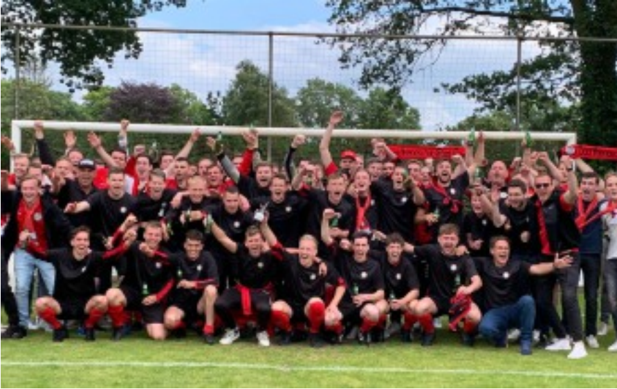
DVSG PROMOVEERT NAAR DE 4e KLASSE.