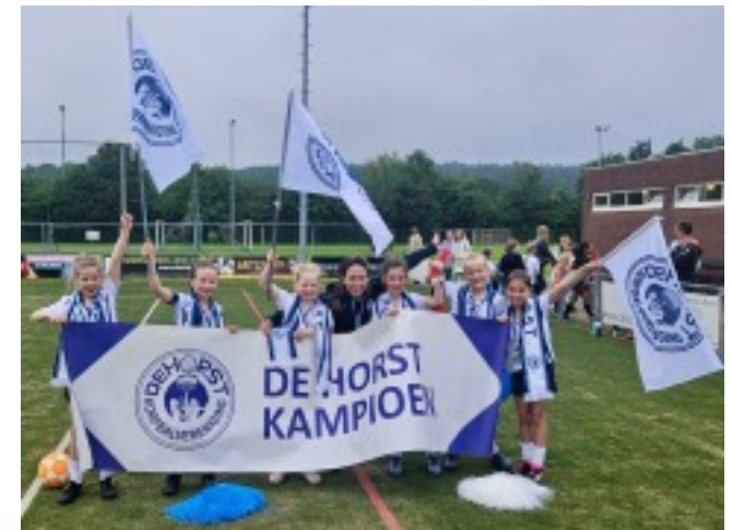
DE HORST D1, D2 & E1 KAMPIOEN