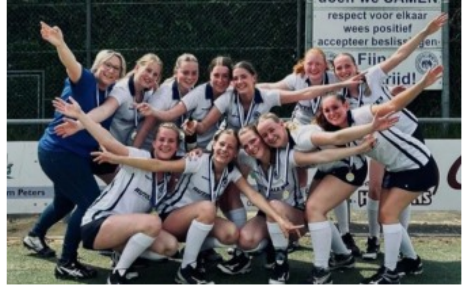
DE HORST A1 KAMPIOEN