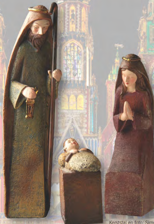
Kerststal en