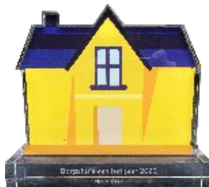
Jaargang 8, nr. 3

De prijs, een fraaie trofee en een cheque van € 2.500,00, werden aan het team van de Slenk uitgereikt door gedeputeerde Peter van 't Hoog.