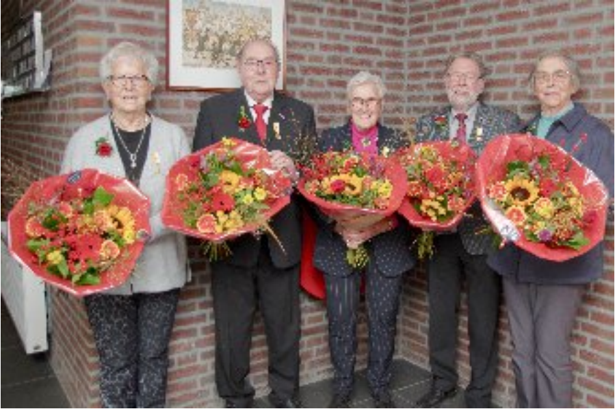
FEESTELIJKE HULDIGING JUBILARISSEN!

Op zondag 20 november j.l. hield kerkkoor HORST SION BREEDEWEG uit Groesbeek haar jaarlijkse St.Caecilia koorfeest, waarbij maar liefst vijf jubilarissen werden gehuldigd.